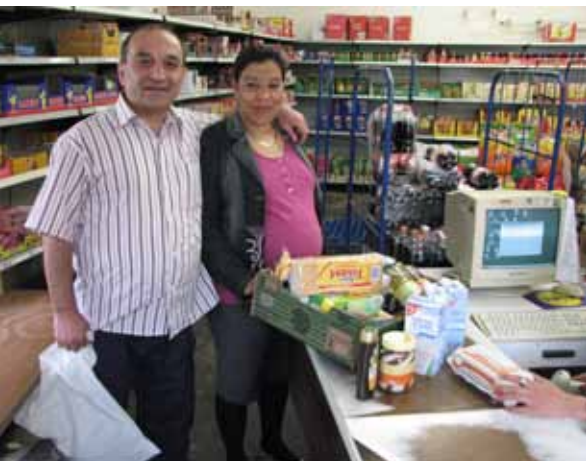
Gute Auswahl, zufriedene Kunden: „Point Store“ in der GU Mannheim.

Ob unterkunftseigene Shops die bessere Alternative zu den Esspaketen sind, darf bezweifelt werden. Meistens gibt es dort dieselben minderwertigen Lebensmittel wie bei den Essenspaketen und die Auswahl hängt von der Bereitschaft der Betreiber