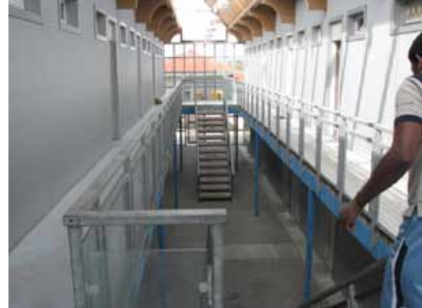
Typ-D-Unterkunft: Die GU Blaufelden liegt am Rand des Landkreises Schw.Hall in einem Industriegebiet. Sie ist im Jahr 2002 neu gebaut worden. Die Architektur erinnert an ein US-Gefängnis - trotz der Solarzellen auf dem Dach. Wer an einem Sprachkurs teilnehmen will, muss ins 40 km entfernte Hall.

TYP C. BARACKE (alter, großer, schlechter ... Wohnblock oder (Wohn-, Industrie-)Baracke mit kleinen gleichförmigen Zimmern und wenig Gemeinschaftsbereichen, Massenlager-Charakter)