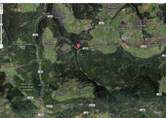
Unterbringung Marke Schwarzwald: Die GU Holzachtal liegt am Rande des Enzkreises. Berg ab kommt nach 3 km der Landkreis Karlsruhe, bergauf kommt erstmal nichts, Am Ort gibt es noch ein Sägewerk.

Die GU Witthoh liegt ca. 15 km entfernt von Tuttlingen auf einem Berg mit schöner Aussicht. Es gibt eine Bushaltestelle. Das ehemalige, jetzt baufällige Hotel erschien den Betreibern als die günstigste Lösung. Alle Flüchtlinge wollen dort weg.