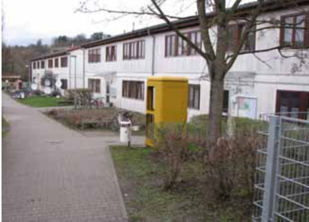
Typ-B-Unterkunft: Die GU Kirchheim/Teck war früher ein Aussiedlerwohnheim. Sie liegt am Rand der Innenstadt und macht außen und innen einen gepflegten Eindruck.